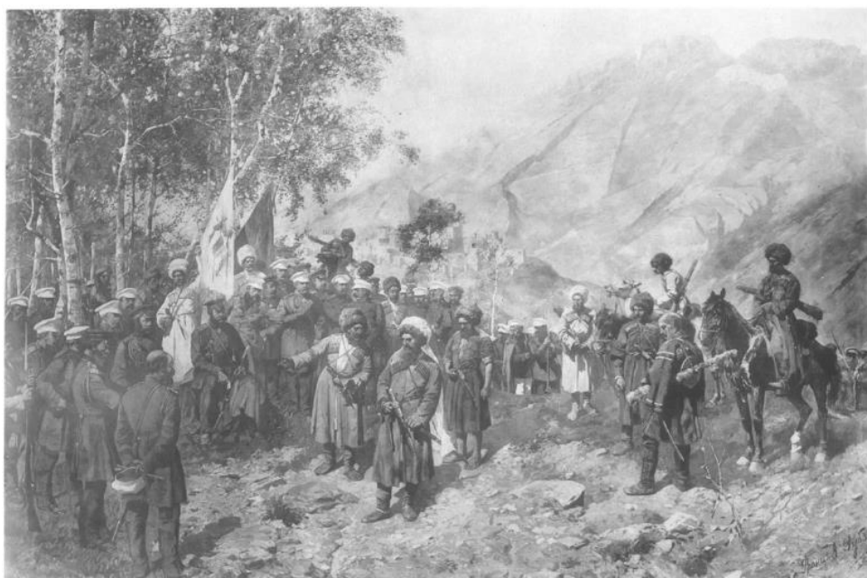
Fig. 2: Tablou care îl înfățișează pe Şamil predându-se generalului rus A.I. Variatinski, în 25 august 1859 (stil vechi), după Боевые подвиги Кавказской армии (Faptele de luptă ale armatei caucaziene) , ed. B.S. Esadze, Tipografia K. Meshiev, Tiflis, 1911.

Gunib au fost luate 4 tunuri și toporul lui Șamil; aproximativ 100 de murizi au fost capturați și același număr au fost uciși ... Isprava eroică de a captura Gunib a completat cu brio o serie de fapte fără precedent realizate recent de glorioasele trupe ale Majestății Sale Imperiale, pe care am norocul să le comand. Nu găsesc cuvinte suficiente pentru a evalua în mod adecvat meritele tuturor gradelor de la general la soldat. Toți și-au îndeplinit datoria cu un curaj și abnegație care îi pune mai presus de orice laude. Acum pot să repet încă o dată: războiul de jumătate de secol din Caucazul de Est s-a încheiat; popoarele care locuiesc în țara de la Marea Caspică până la Drumul Militar georgian au căzut la picioarele Majestății Sale Imperiale.>> (nota 1056 în AKAK, 1904, pp. 1178-1179, traducerea autorului).